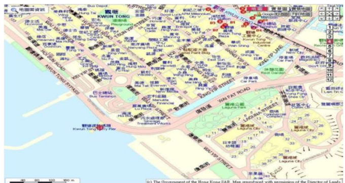
觀塘汽車渡輪碼頭